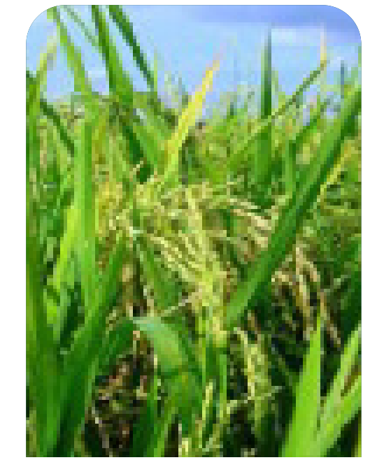
Llenado del grano (embuche)