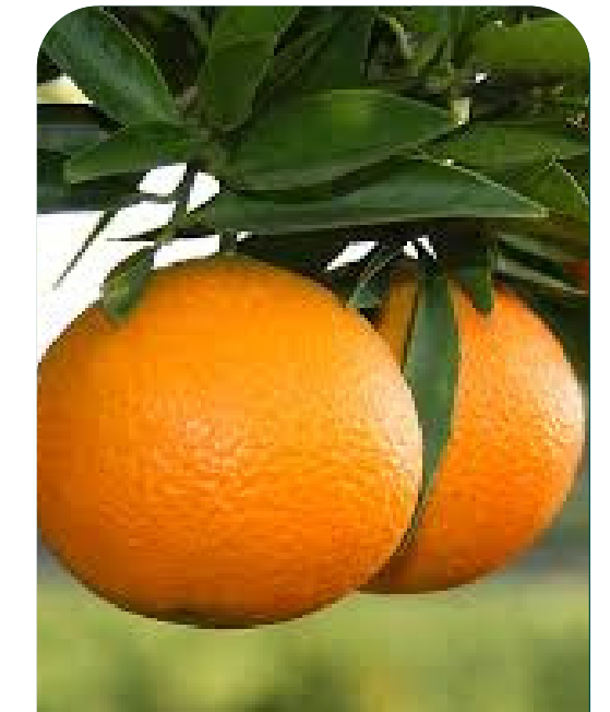
Maduración de Fruto ( Fase 3)