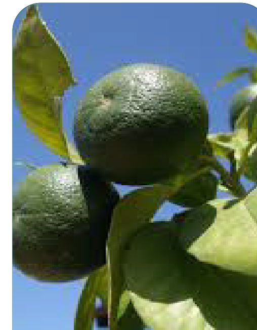
Crecimiento de Fruto (inicio Fase 2)