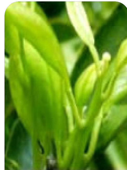
Brotación de Primavera