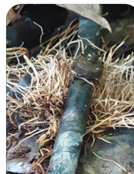
1º Flush radicular