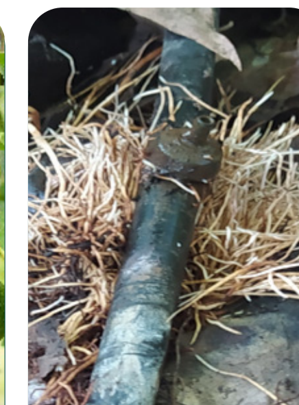
2º Flush radicular