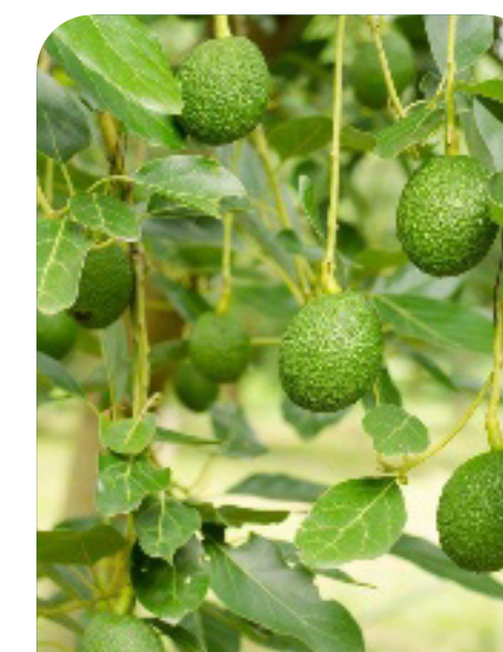
Desarrollo del fruto