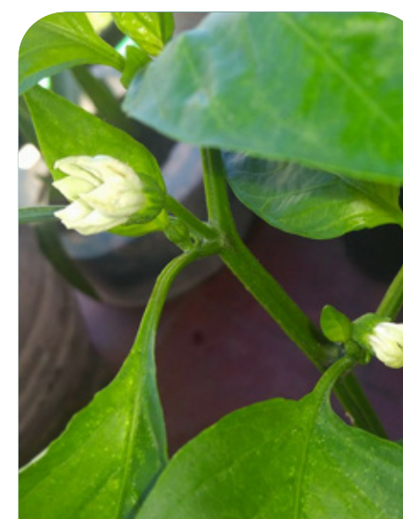
Inicio de floración