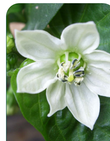
Final de la floración