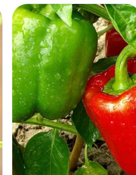
Madurez primeros frutos