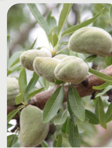
CRECIMIENTO DE FRUTO A MADURACIÓN