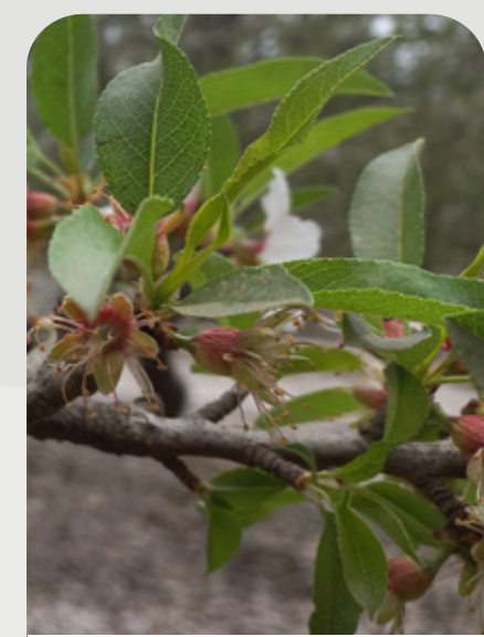
CUAJA Y BROTAÇÃO