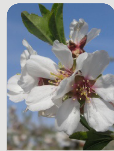
FLORACIÓN INICIO BROTAÇÃO