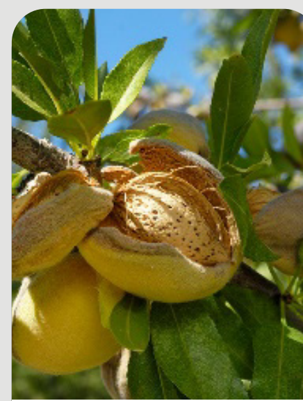
RAJADURA DEL PELON A POST COSECHA