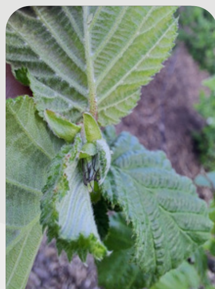
DESARROLLO DEL ÓVULO