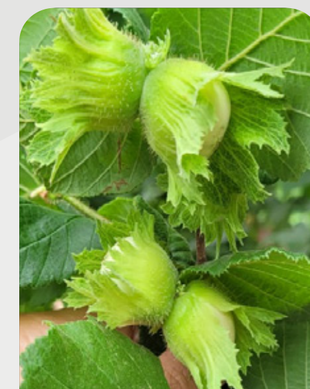
CRECIMIENTO DE FRUTOS