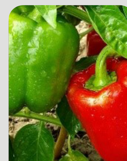
MADURACIÓN DE FRUTOS