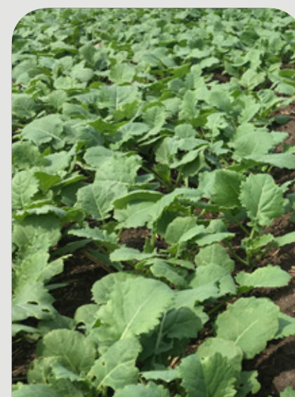
ROSETA / ELONGACIÓN