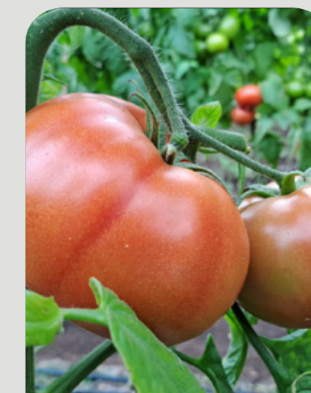
MADURACIÓN DE FRUTOS