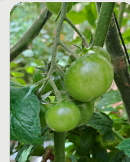
DESARROLLO DE FRUTO