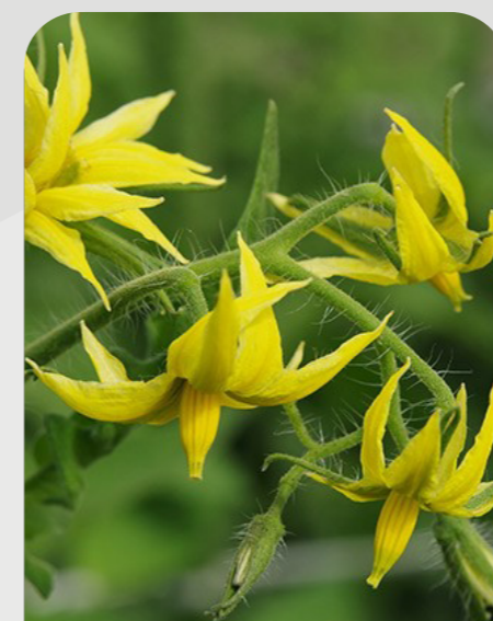
FLORACIÓN Y CUAJA